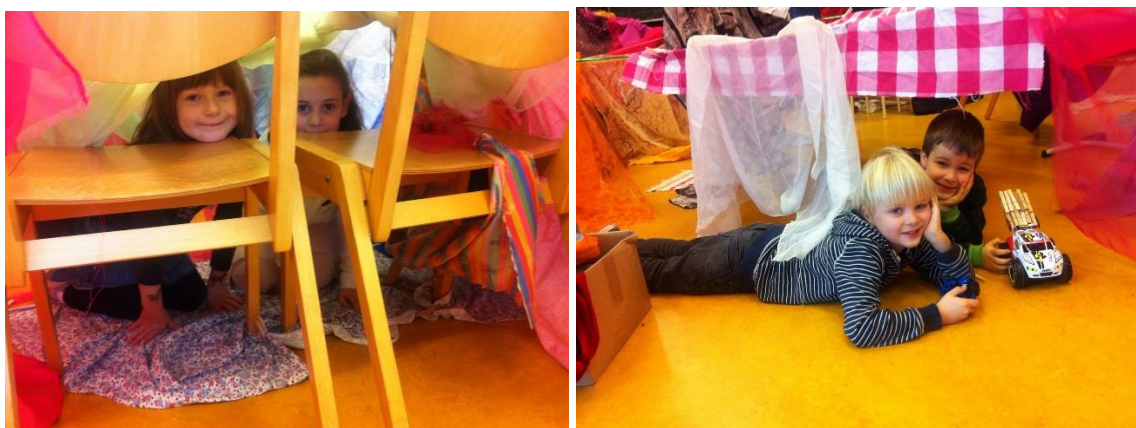
Hutten bouwen in groep 1/2.

Overigens blijft het voor alle overige zaken natuurlijk belangrijk dat u altijd in contact blijft met de leerkracht van uw kind.