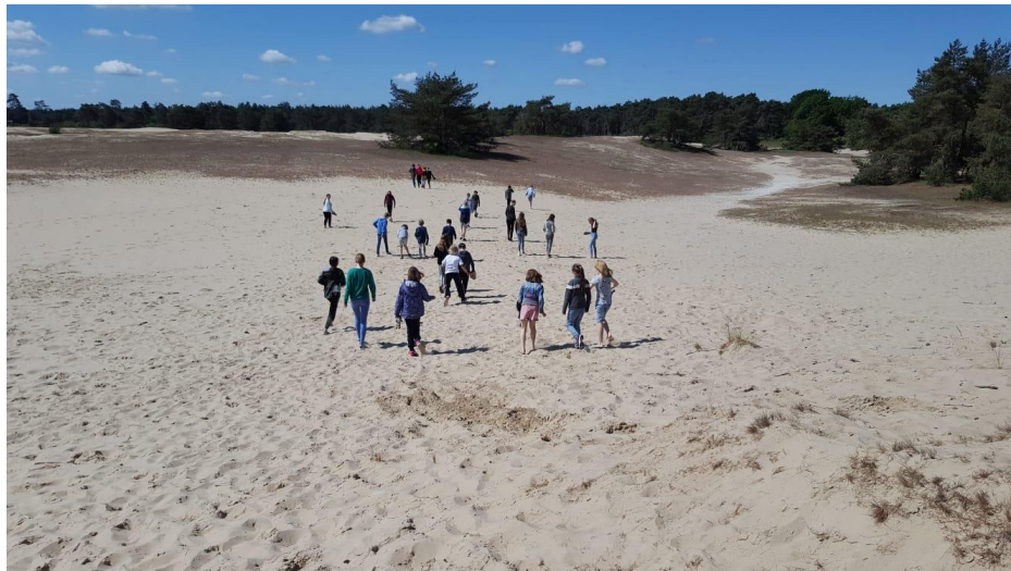
Wandelen door de zandverstuiving op kamp

De avond vangt aan om half 8 . De kinderen van groep 8 bakken allemaal een heerlijke taart, zodat we een feestelijke tafel vol lekkernijen hebben!