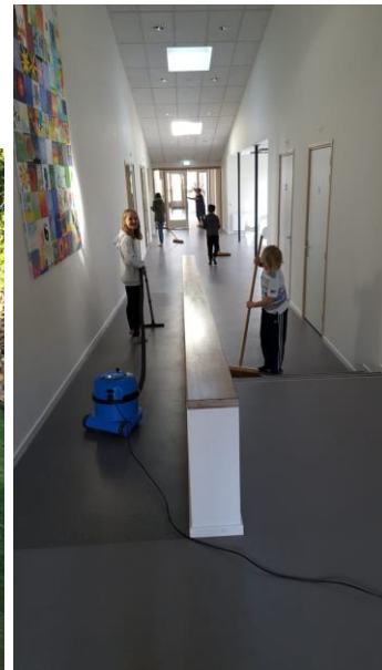
En weer schoonmaken.