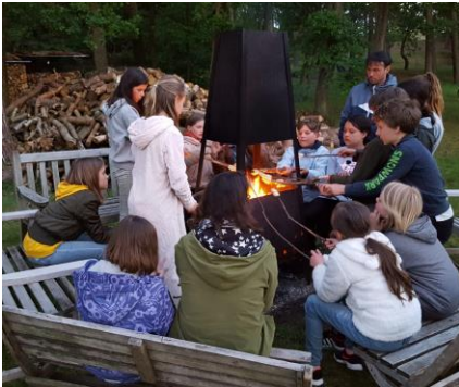
Broodjes bakken op kamp.

En dat het allemaal weer ontzettend leuk was, heeft u vast al van uw kinderen vernomen. Alle ouders die deze uitjes hebben begeleid of nog gaan begeleiden, willen wij bij deze nogmaals heel hartelijk danken voor alle hulp en ondersteuning!