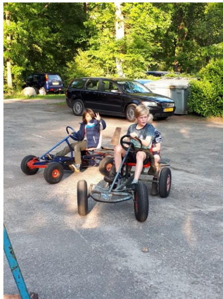
Weerwolven en skelteren op kamp.