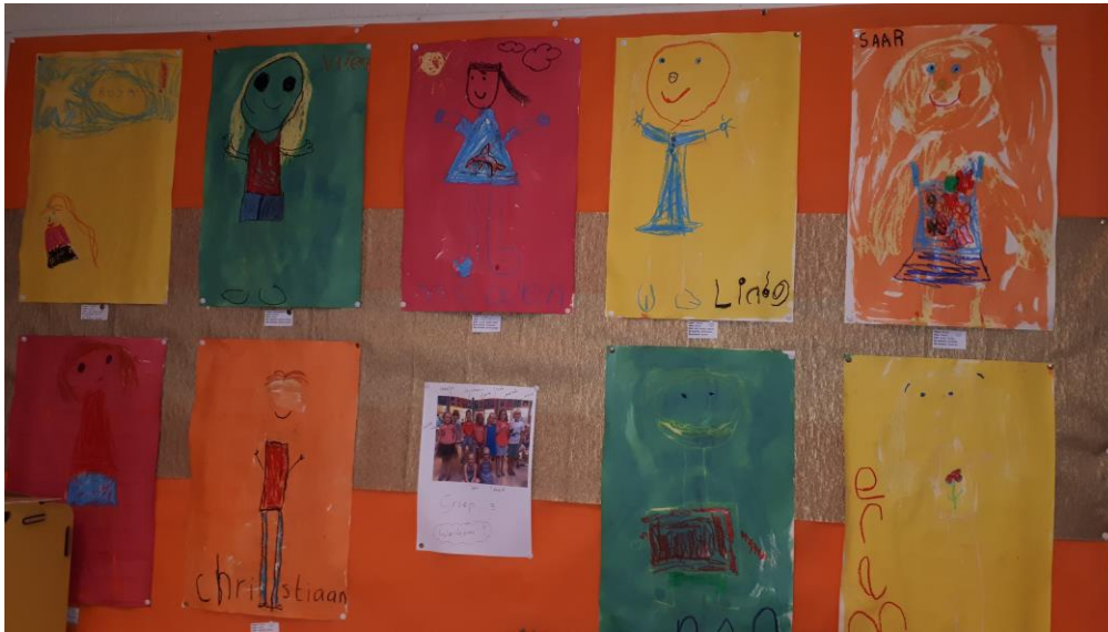
Vrolijke kinderen uit groep 3/4.

Vanaf volgende week ongeveer zullen ze gaan starten met het aanleggen van nieuwe riolering in de Arklaan. U zult hier met het brengen en halen van uw kinderen rekening mee moeten gaan houden.